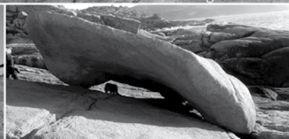
Il-blata li tiżfen