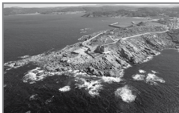
Is-Santwarju qrib il-baħar

Leggenda oħra ssemmi kif darba, wara li kienu dahħlu x-xbieha tal-Verġni fil-knisja ta' Muxia,