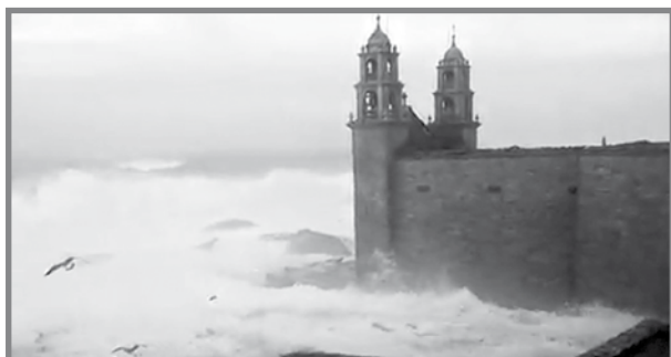
Mewġ qawwi tal-Atlantiku jaħbat mas-Santwarju

Dawn kienu l-ħsibijiet li għaddew minn moħħi, hekk kif, nhar l-Erbgħa 23 ta' Marzu 2016 ħabib, poeta, għalliem Galizjan, ħadna lili u lil ibni, inżuru u naraw ftit mill-bosta dehriet memorabbli, matul il-Costa da Morte, (Xatt il-Mewt), fil-Galizja, Spanja. Kont naf li sabiħa din l-art, minn xi kliem li kont smajt fuq CD, 'Nunca Mais' dwar diżgrazzja ambjentali fl-istess ibhra.