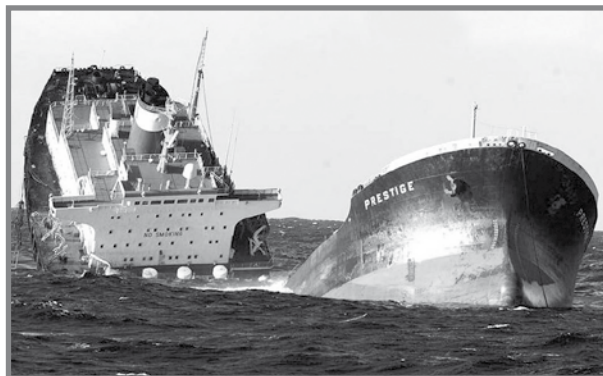
It-tanker 'Prestige' maqsum minn nofs kawża tal-maltemp

Irdumijiet weqfin, xtajtiet imrammlin, riħ qawwi, mewġ kbir joħloq rawgħa madwar skollijiet ppuntati, gawwi u tajr ieħor tal-baħar itiru bla waqfen ilkoll joffru xeni spettakolari. Mewġ feroċi li ġej mill-Atlantiku, li jkarkar u jkisser kulma jsib quddiemu. Mhux ta' b'xejn li ilha li ssejthet Costa da Morte, għaliex f'inqas minn mitt sena kien hemm iktar minn sittin nawfraġju, f'dawn l-inħawi. Aktarx li l-agħar tragedja kienet dik tal-HMS Serpent, li fih, fl-1890, kienu gherqu 172 baħħar Inġliż. Grajja oħra